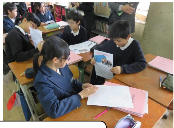
6年生「My best memory is～」 交流の場面とふりかえりカード