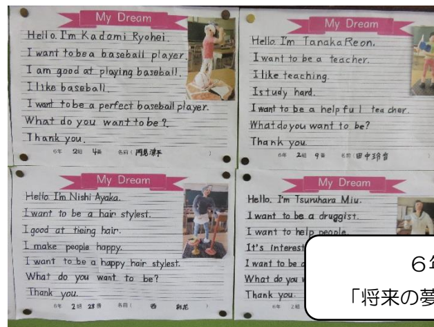
6年生 「将来の夢」の英作文