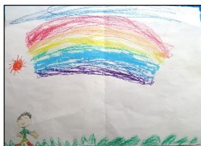
1-1 田中 誠次郎 君